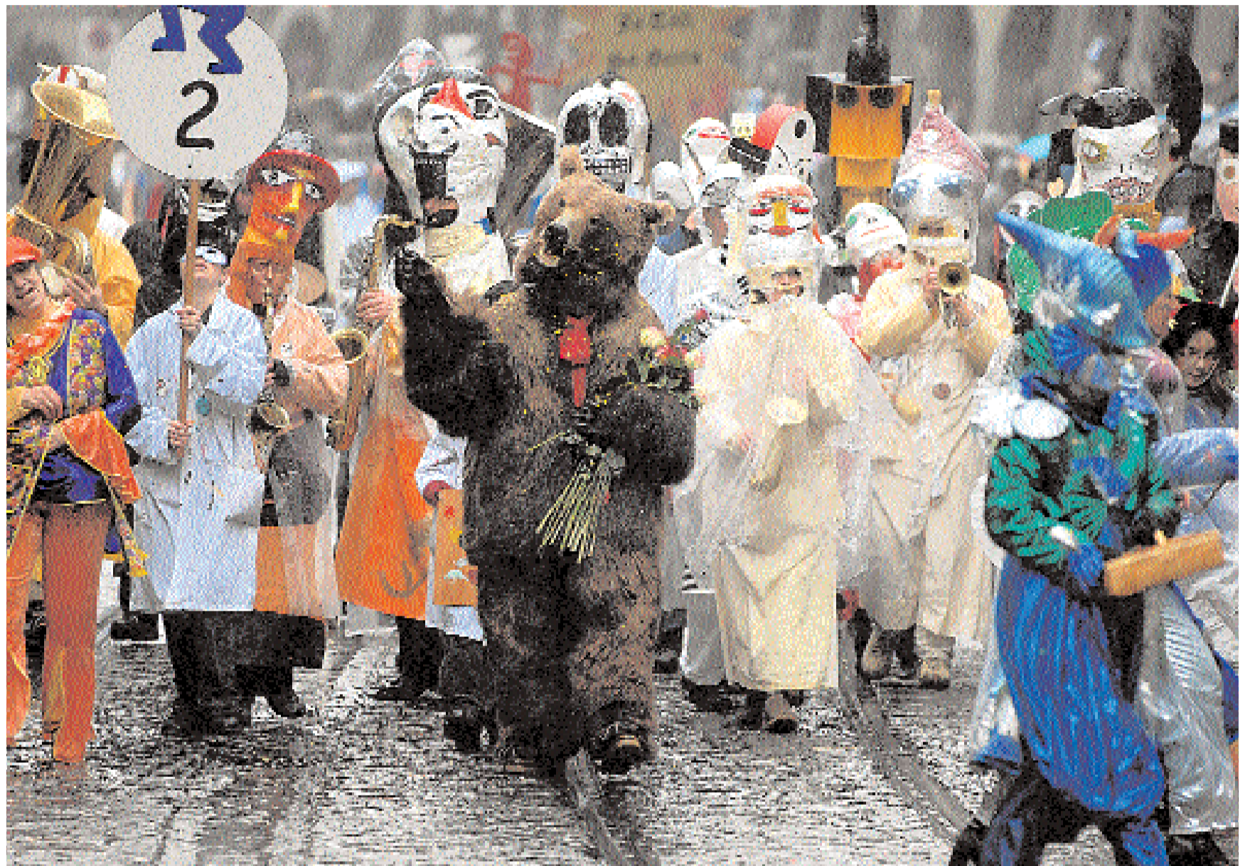
Der Fasnachtsbär und seine Anhänger trotzen am Umzug vom Samstagnachmittag dem Regenwetter.