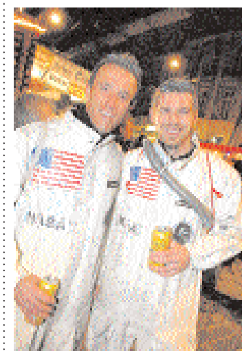
Das Bier haben die Astronauten immer griffbereit.